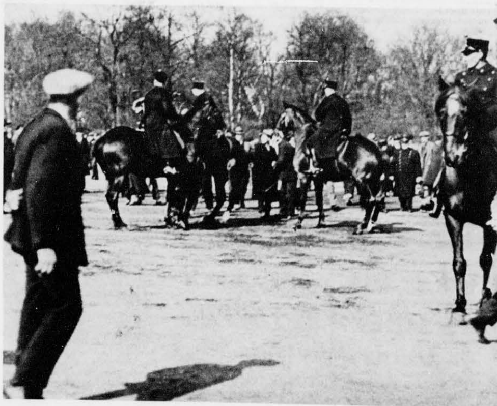
Politi mot streikende jernarbeidere under storstreiken i 1923. Bildet er fra Studentertunden i Oslo sentrum. Arbeiderklassen var den indre fienden i